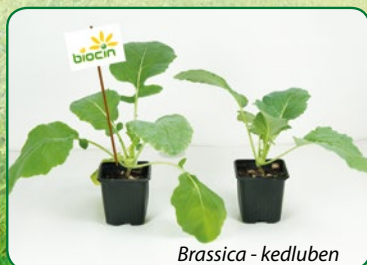
Brassica - kedluben

Srovnání vybraných rostlin po 7 týdnech.