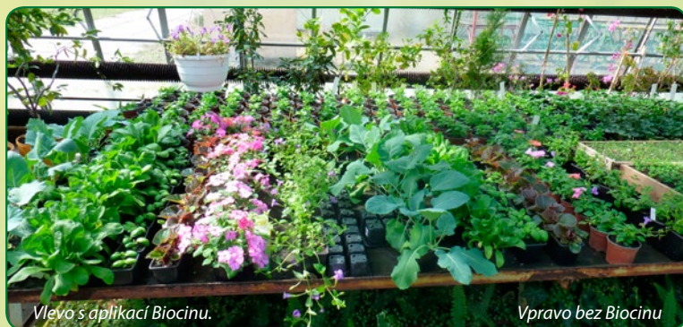
Vlevo s aplikací Biocinu.

Po 7 týdnech již květiny s aplikací Biocinu kvetly, zatímco bez aplikace teprve začínaly kvést.