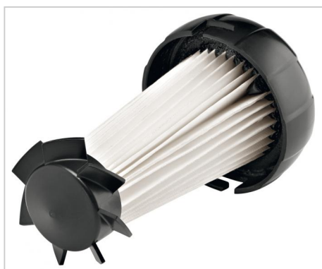
PES-filtr na výměnu pro PES-filtrovou kazetu 407.984.