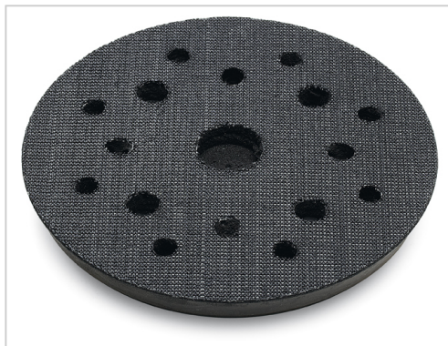
Unášecí talíř z vysoce odolného speciálního materiálu s otvory na odsávání (8x). Rozteč otvorů průměru 90 mm.