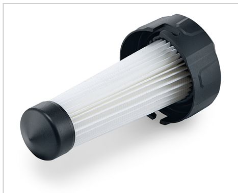
PES-filtr na výměnu pro PES-filtrovou kazetu 486.833.