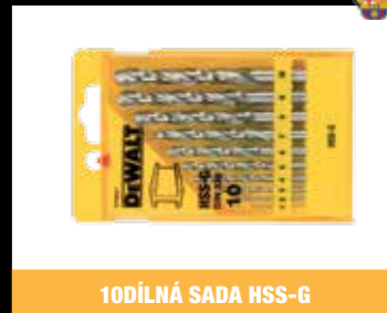
10DÍLNÁ SADA HSS-G