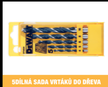
5DÍLNÁ SADA VRTÁKŮ DO DŘEVA