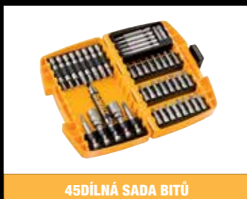
45DÍLNÁ SADA BITŮ