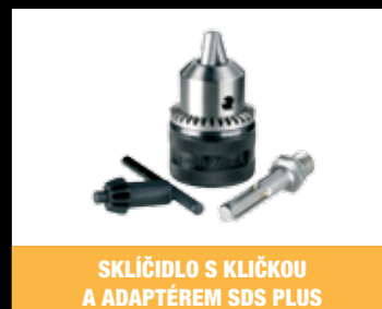
SKLIČIDLO S KLIČKOU A ADAPTÉREM SDS PLUS