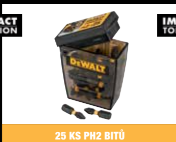
25 KS PH2 BITŮ