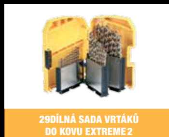
29DÍLNÁ SADA VRTÁKŮ DO KOVU EXTREME 2