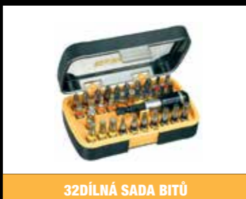
32DÍLNÁ SADA BITŮ