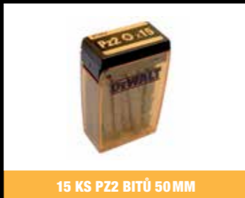
15 KS PZ2 BITŮ 50 MM