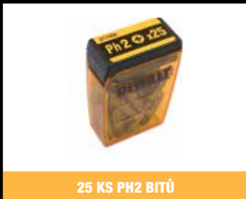
25 KS PH2 BITŮ