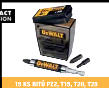
15 KS BITŮ PZ2, T15, T20, T25