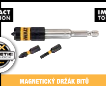
MAGNETICKÝ DRŽÁK BITŮ