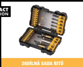
26DÍLNÁ SADA BITŮ