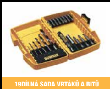
19DÍLNÁ SADA VRTÁKŮ A BITŮ