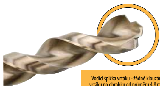
Vodící špička vrtáku - žádné klouzáni vrtáku po obrobku od průměru 4,8 mm