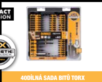
40DÍLNÁ SADA BITŮ TORX