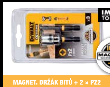
MAGNET. DRŽÁK BITŮ + 2 x PZ2