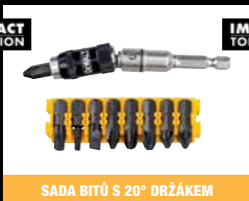
SADA BITŮ S 20° DRŽÁKEM