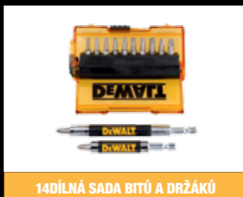
14DÍLNÁ SADA BITŮ A DRŽÁKŮ