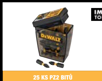
25 KS PZ2 BITŮ