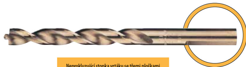
Neprotkluzující stopka vrtáku se třemi ploškami pro lepší uchycení ve vrtačce - od průměru 5 mm