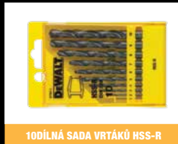
10DÍLNÁ SADA VRTÁKŮ HSS-R