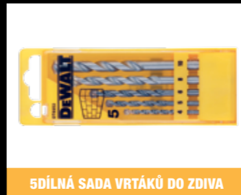
5DÍLNÁ SADA VRTÁKŮ DO ZDIVA