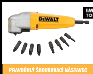
PRAVOUHÝ ŠROUBOVACÍ NÁSTAVEC