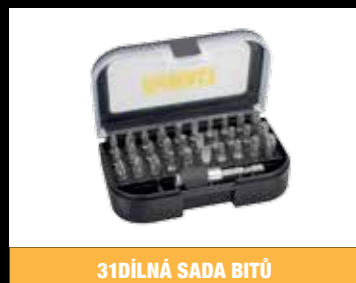
31DÍLNÁ SADA BITŮ