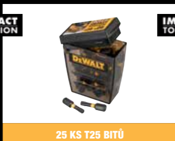
25 KS T25 BITŮ