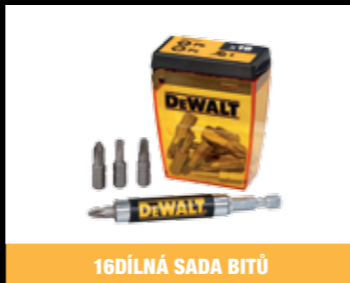
16DÍLNÁ SADA BITŮ