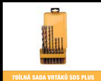
7DÍLNÁ SADA VRTÁKŮ SDS PLUS