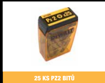
25 KS PZ2 BITŮ