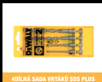
4DÍLNÁ SADA VRTÁKŮ SDS PLUS