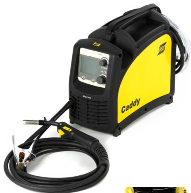
Svařovací zdroj s ramenním popruhem