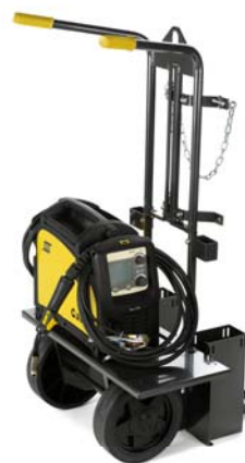
Vozík – pro snadnou přepravu zdroje Caddy® Mig a plynové lahve.

Obsah balení: zabudovaný hořák 3m, napájecí kabel 3m, plynová hadice 4,5 m s rychlospojkou, zemnicí kabel se svorkou, jednoduchý ramenní popruh, kompletní příslušenství hořáku pro drát Ø 0,8mm, manuál. Cívka drátu OK Autrod 12.51, 0.8 mm - 1kg.