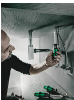
Dutý dřík pro přesahující závitové tyče